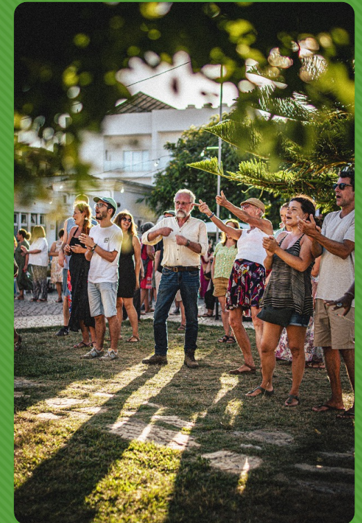
Community festival "Windows of São Luís"