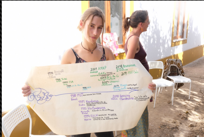
Using collaborative tools